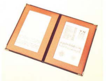
Mod. 4110 - Test per lettura da vicino - Near vision test - Test de vision de près