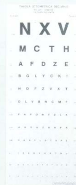
Mod. 4097 MONOYER - (3 m.)