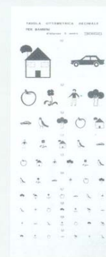
Mod. 4108 Bambini-Children- Enfants (5 m.)