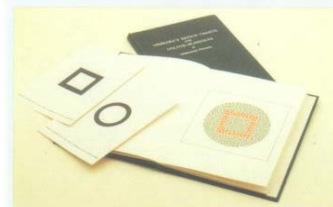
Mod. 4234/B - Serie di tavole pseudoisocromatiche sec. ISHIHARA per bambini - Set of pseudoisochromatic tables of ISHIHARA for children - Série de tables pseudoisochromatiques selon ISHIHARA pour enfants

M S P R O O N A S S N E R I N O N L I N O O L N O Y E N A W E R N U S D S S