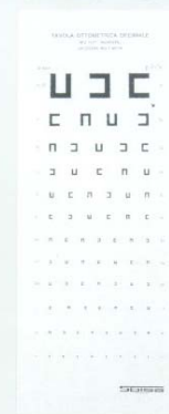
Mod. 4098 MONOYER - (3 m.)