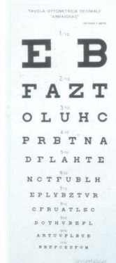
Mod. 4089 ARMAIGNAC - (5 m.)