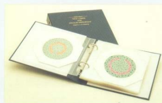
Mod. 4234/N - Serie di tavole sec. OHKUMA - Set of tables of OHKUMA - Série de tables selon OHKUMA