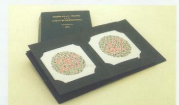
Mod. 4234 - Serie di tavole pseudoisocromatiche sec. ISHIHARA - 38 test - Set of pseudoisochromatic tables of ISHIHARA - 38 tests - Série de tables pseudoisochromatiques selon ISHIHARA - 38 tests